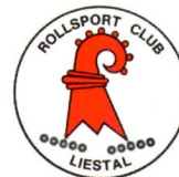
Rollsport Club Liestal