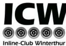
Inline Club Winterthur