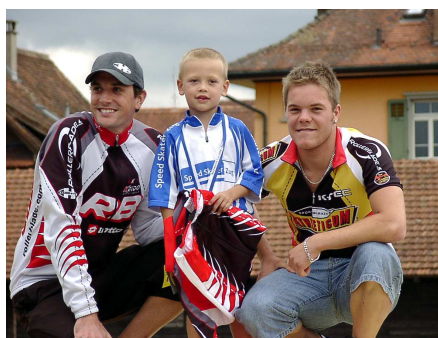
Keiner zu klein, ein Winner zu sein

Bereits beim Einlaufen kommt es zu „privaten“ Duellen untereinander. Wenn auch der Wettstreit an sich nicht in erster Linie im Vordergrund steht, die Jungsten wollen sehen, wer am schnellsten laufen kann. Die gewonnenen Eindrucke sind einmalig und unvergesslich. Eine wahre Augenweide und ein Genuss, dem Surren der schnellen Rollen zu lauschen.