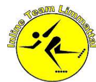
Inline Team Limmatal