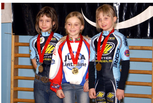
Stolz und uberglucklich

Wer als Zaungast einer Etappe beigewohnt hat, der weiss, wo die Begeisterung fur diese Sportart zu suchen ist. Der Spass an dieser rasant schnellen Freizeitbeschaftigung kommt keineswegs zu kurz, was die vielen Bilder unter www.nachwuchs-cup.ch sicherlich zu dokumentieren vermogen. Eine weitere positive Entwicklung und Optimierung dieses Anlasses darf erwartet werden, weil der Verband die Etappen zur Selektion fur die Junioren-EM in Danemark heranziehen wrd. Dies ist ein Signal, dass noch weitere auslandische Delegationen in die Schweiz reisen. Und so konnen sich sie die Unseren auf die WM 2009 bestens vorbereiten.