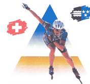
Rollsport Club Aaretal