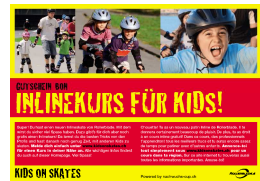
Kids on Skates