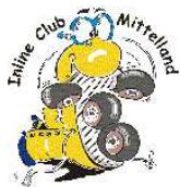
Inline Club Mittelland